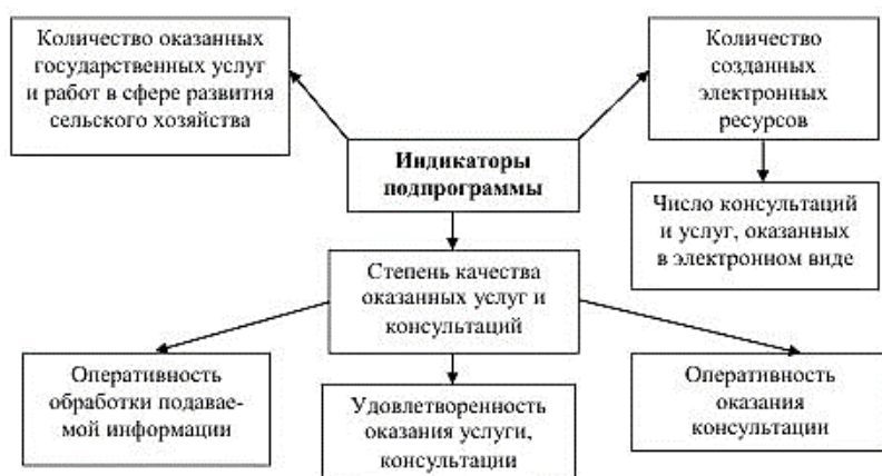
Рис. 5. Схема оценки реализации подпрограммы «Обеспечение функций управления реализацией к Государственной программе Приморского края развития сельского хозяйства» с использованием новых индикаторов

Создание торгово-информационных электронных площадок могло бы помочь в создании еще одного индикативного показателя в рамках данной подпрограммы (степень качества оказанных государственных услуг сельхозпроизводителям). Оперативный сбор информации путем интернет-анкетирования, а также другие методы сбора информации позволят установить прямой диалог между департаментом сельского хозяйства Приморского края и сельхозтоваропроизводителями. Это значительно улучшит качество и спектр предоставляемых государственных услуг. Схема оценки реализации подпрограммы «Обеспечение функций управления реализацией к Государственной программе Приморского края развития сельского хозяйства» с использованием новых индикаторов, представлена на рисунке 5.