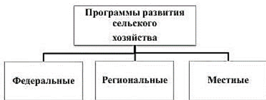
Рис. 1. Виды программ развития сельскохозяйственного производства

ональные, содержащие ряд мер воздействия и комплекс различных мероприятий, направленных на регулирование отдельных отраслей в составе Российской Федерации, а также местные программы.