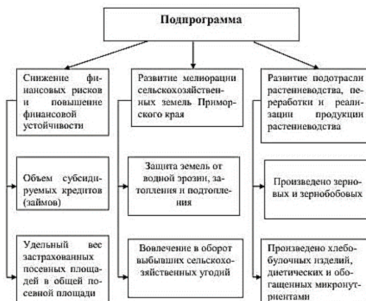
Рис. 2. Частные показатели подпрограмм государственной программы развития сельского хозяйства Приморского края

Показатели подпрограмм рассчитаны на комплексное развитие агропромышленного комплекса с учетом агроклиматических условий Приморского края. В рамках подпрограммы «Развитие мелиорации сельскохозяйственных земель Приморского края» имеется ряд мероприятий, которые служат барьером в противостоянии неблагоприятных проявлений климата. Это такие мероприятия, как защита земель от водной эрозии, затопления и подтопления, строительство новых сооружений и реконструкция уже имеющихся.