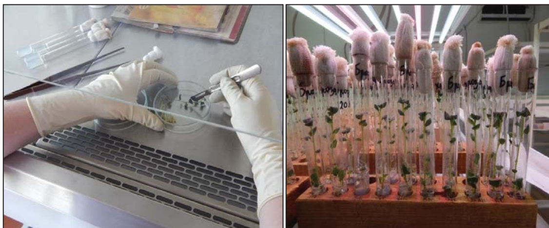
Рис. 1. Микрочеренкование растений картофеля в асептических условиях ламинар-бокса, культивирование растений in vitro

Подготовку материалов, среды выполняли согласно рекомендациям Бутенко Р.Г.[11]. Пробирки с микроклонами картофеля культивировали при освещенности 3,0-3,5 клк светодиодными лампами белого света (СПБ-T5-есо), температуре 22 \pm 3^{\circ}\text{C} , 16 часовом световом дне, влажности воздуха 60-70%. Измерение морфометрических показателей у микрорастений осуществляли на 15-й, 20-й и 25-й день, подсчет числа междоузлий у сформировавшихся растений – на 25-й день. Статистическую обработку результатов экспериментов проводили согласно методике Б.А. Доспехова [12].