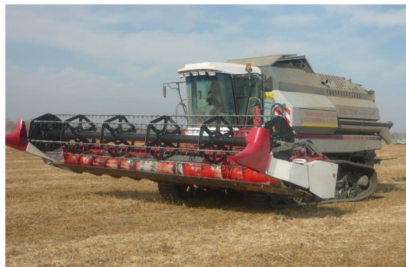
Рис. 2. Зерноуборочный комбайн «Vector 450 Track»

В ходе проведения комплексной оценки работы данных комбайнов на уборке сои в 2011 году программа экспериментальных исследований, в том числе, предусматривала определение нагрузок на опоры с определением положения центра тяжести, нормального давления на почву и показателей техногенного механического воздействия на почву движителей комбайнов.