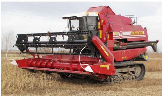
Рис. 1. Соевый комбайн GS 812C «Амур-Палессе»